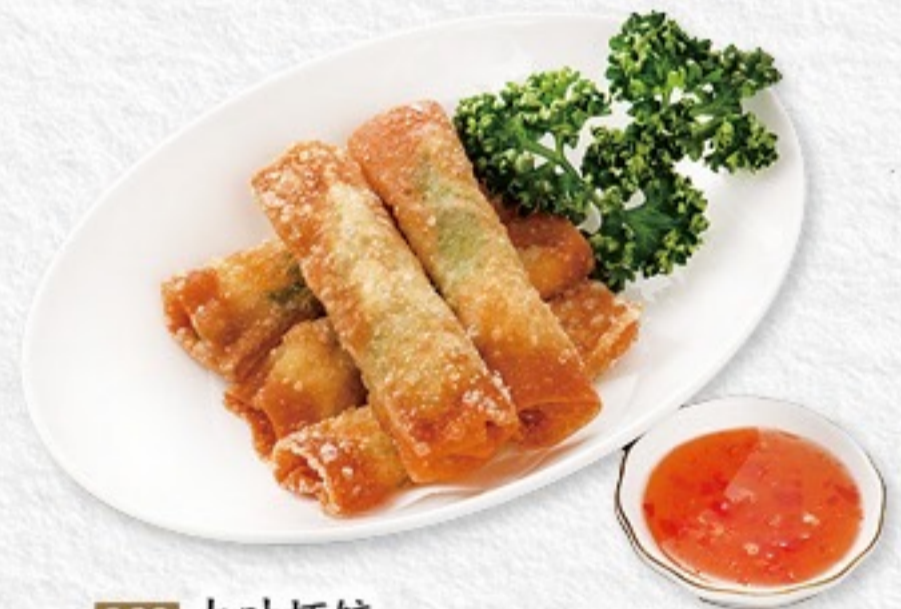
028 大叶虾饺 海老大葉巻き(4ヶ) 480円(税込528円)