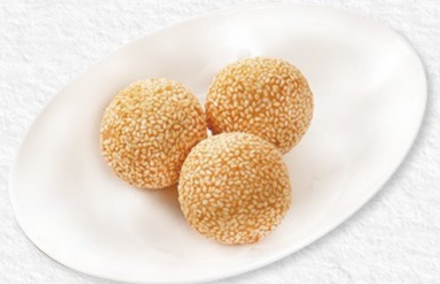
030 芝麻球 ゴマ団子(3ヶ) 450円(税込495円)