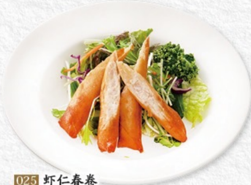
025 虾仁春卷 海老春巻き(3ヶ) 380円(税込418円)