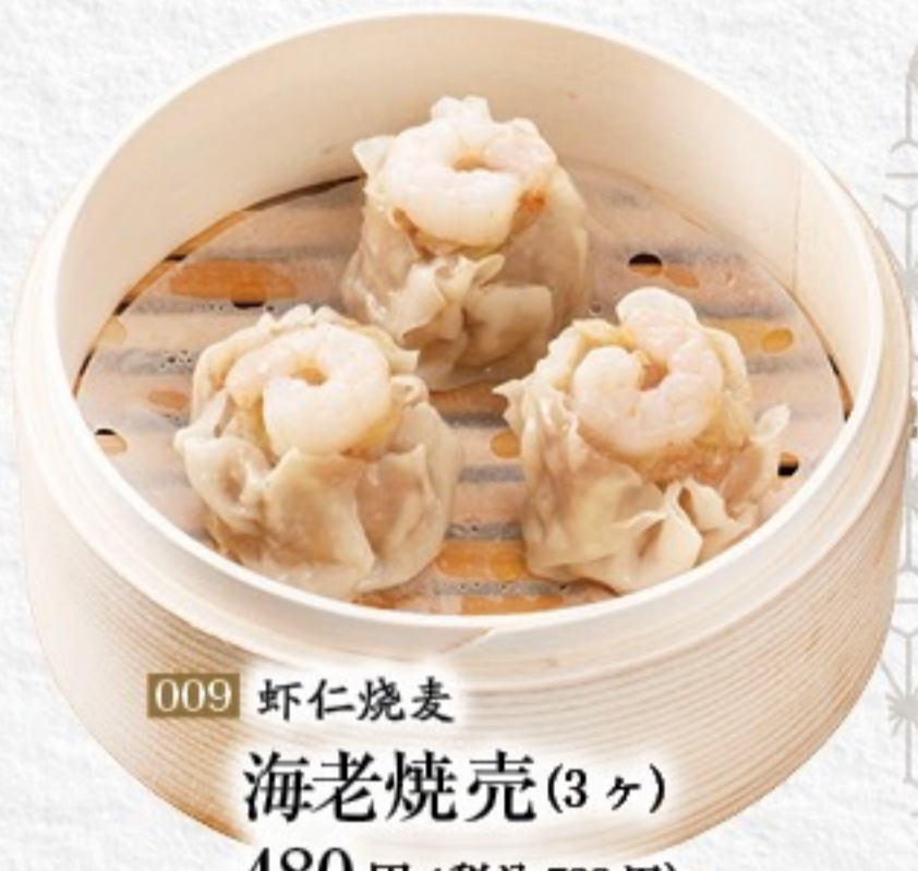
009 虾仁烧麦 海老焼売(3ヶ) 480円(税込528円)