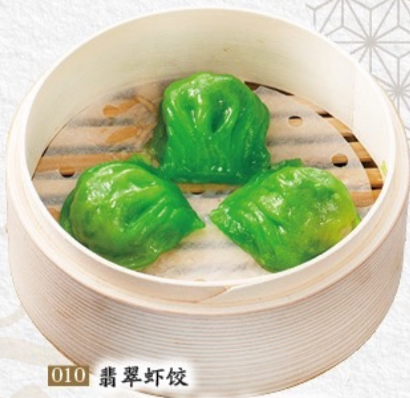
010 翡翠虾饺 ヒスイ海老餃子(3ヶ) 450円(税込495円)