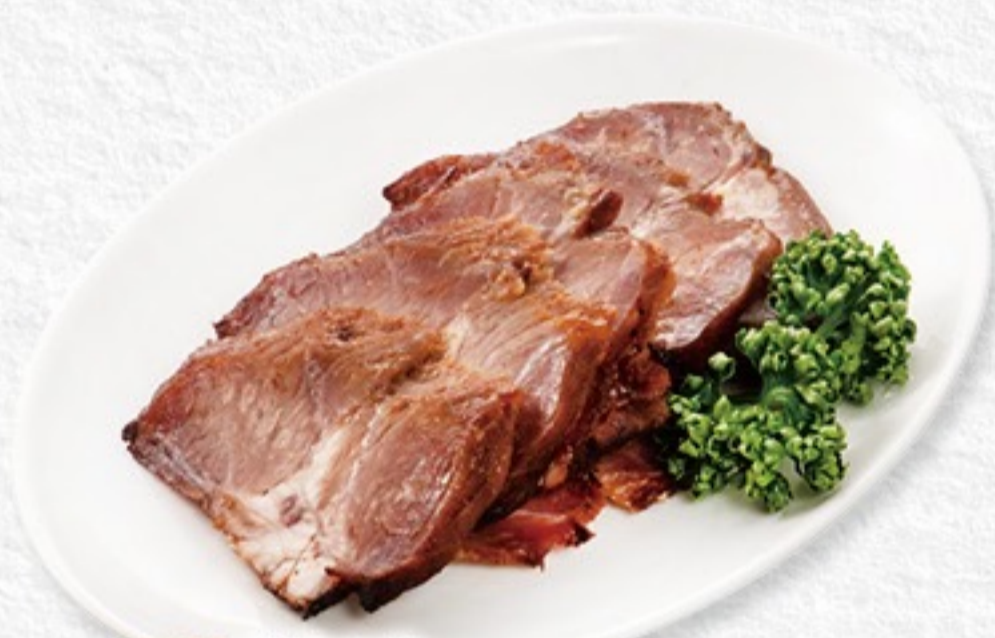
037 蜜汁叉烧 チャーシュー 780 円 (税込 858 円)