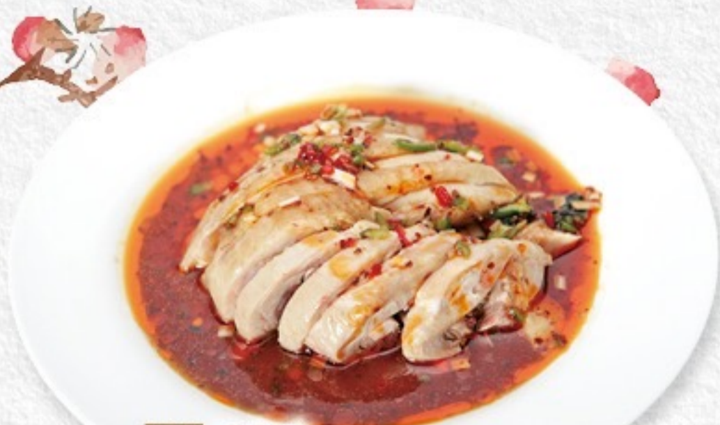
036 口水鸡 よだれ鶏 550 円 (税込 605 円)