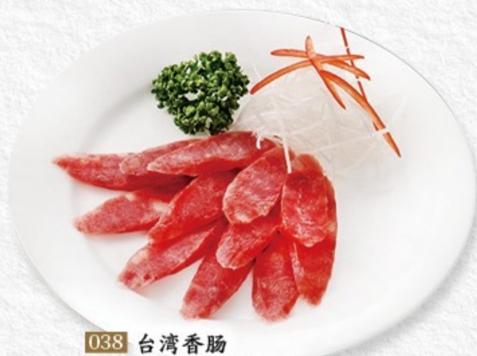
038 台湾香肠 台湾腸詰め 580 円 (税込 638 円)