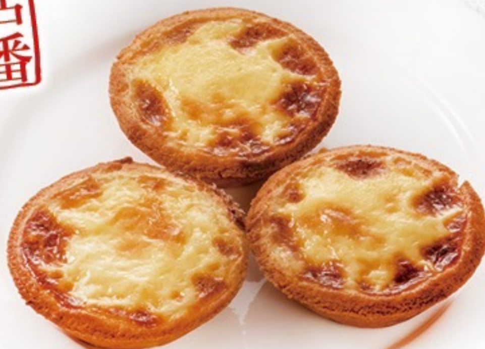
034 葡式蛋撻 エッグタルト(2ヶ) 680円(税込748円)