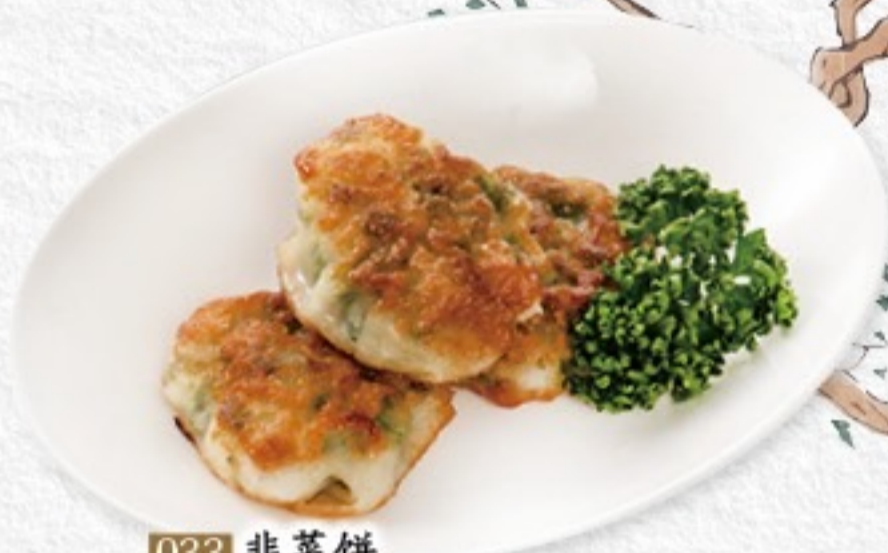
033 韭菜餅 ニラ饅頭(3ヶ) 480円(税込528円)