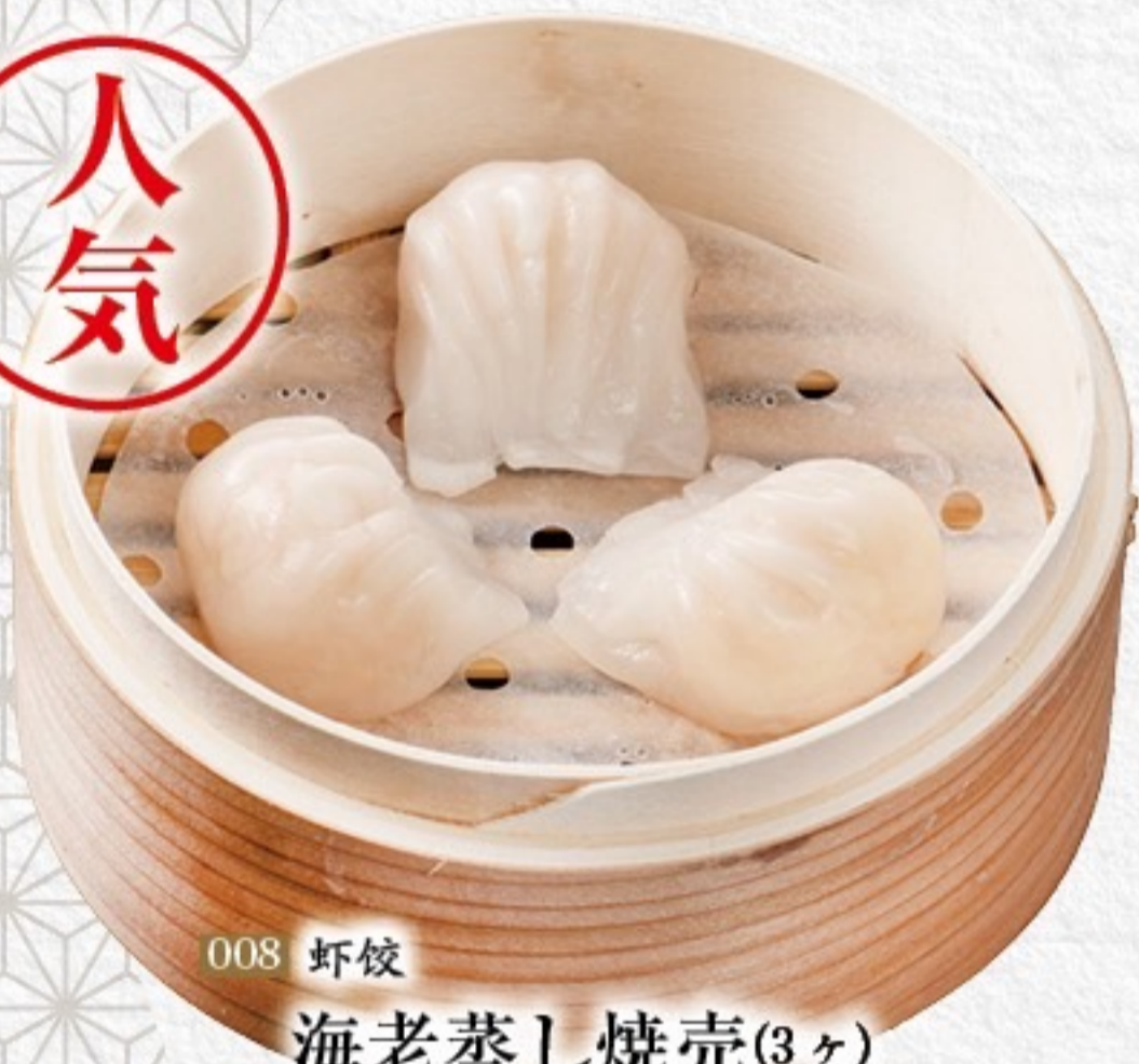
008 虾饺 海老蒸し焼売(3ヶ) 450円(税込495円)