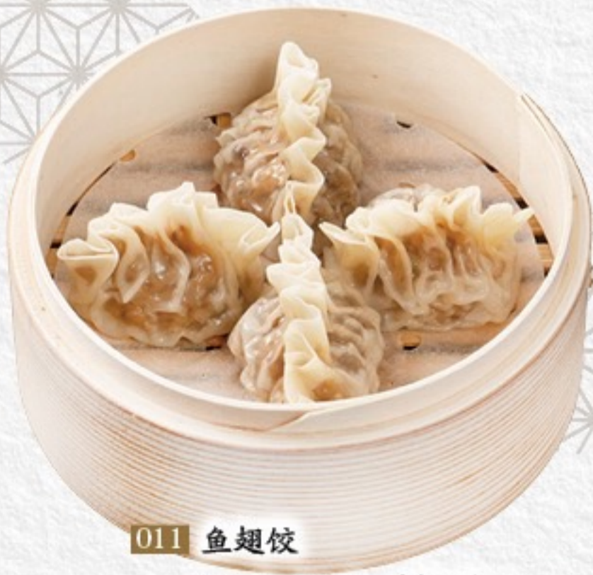
011 鱼翅饺 フカヒレ餃子(3ヶ) 480円(税込528円)