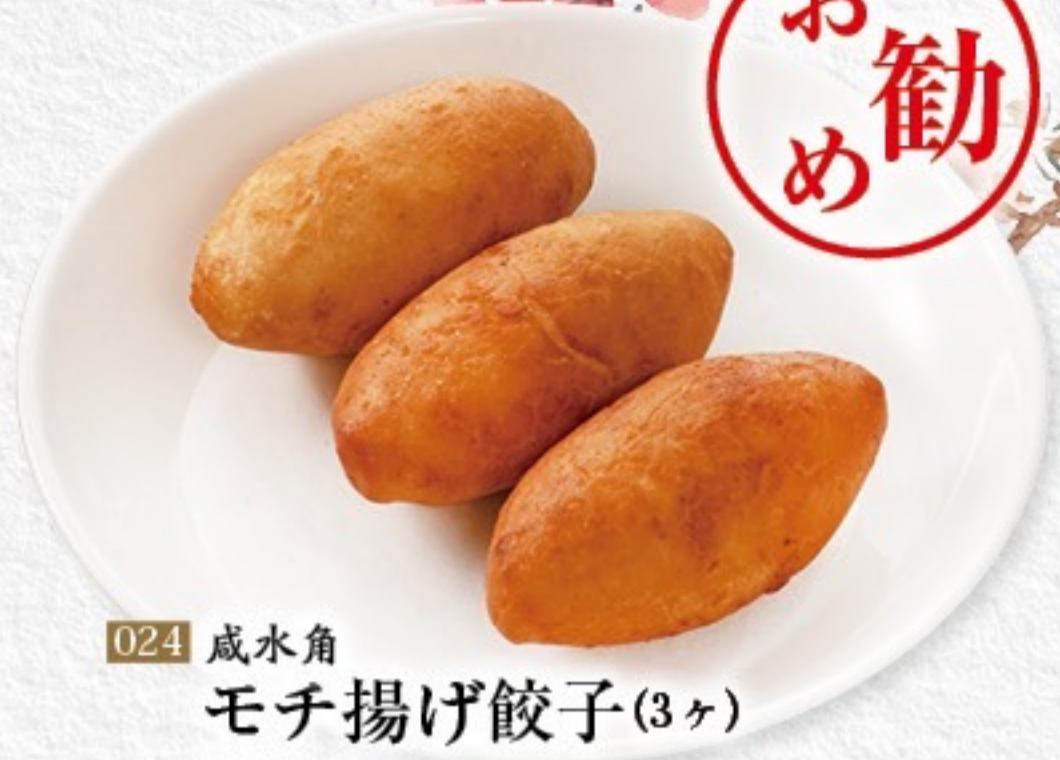
024 咸水角 モチ揚げ餃子(3ヶ) 550円(税込605円)