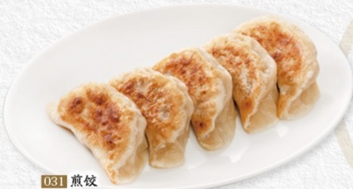
031 煎餃 焼き餃子(5ヶ) 420円(税込462円)