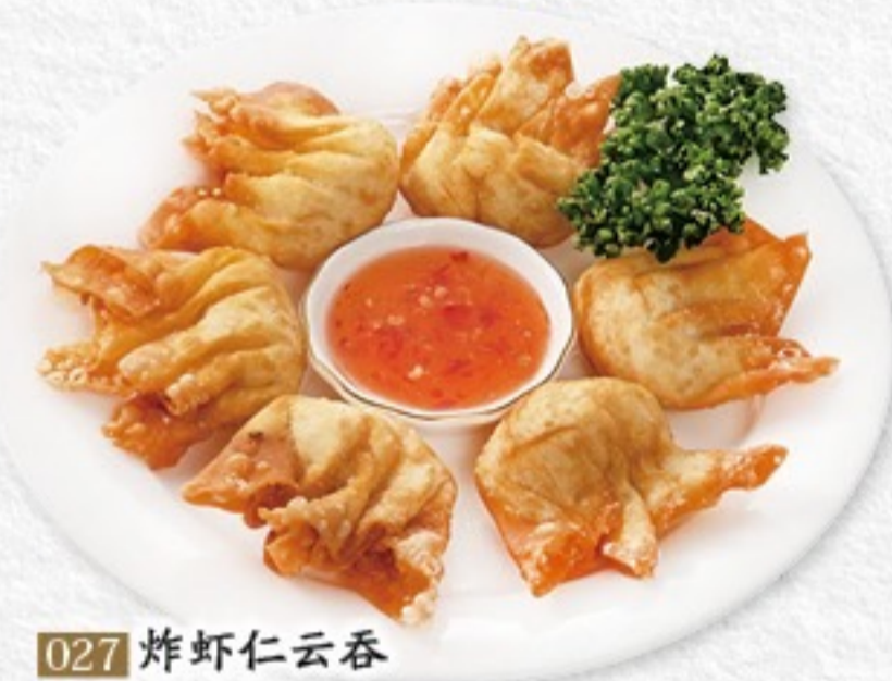
027 炸虾仁云吞 海老揚げワンタン(5ヶ) 550円(税込605円)