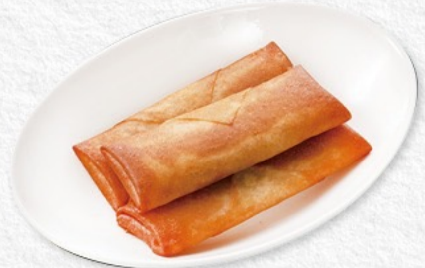
026 五目春卷 五目春巻き(3ヶ) 450円(税込495円)