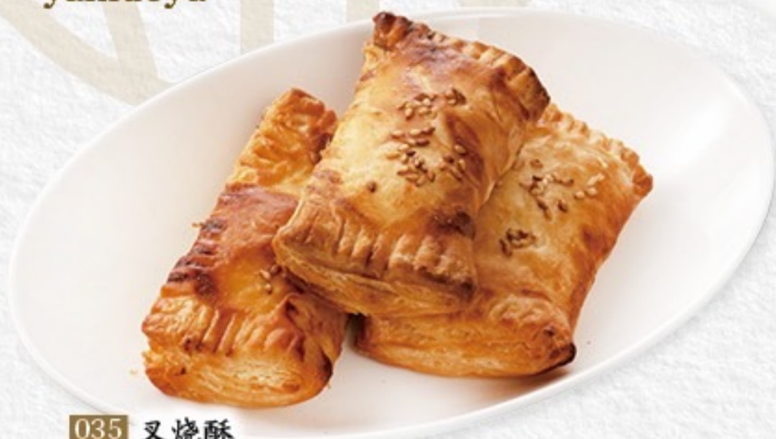
035 叉燒酥 チャーシューパイ(2ヶ) 550円(税込605円)