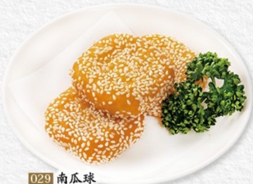
029 南瓜球 カボチャモチ(3ヶ) 450円(税込495円)