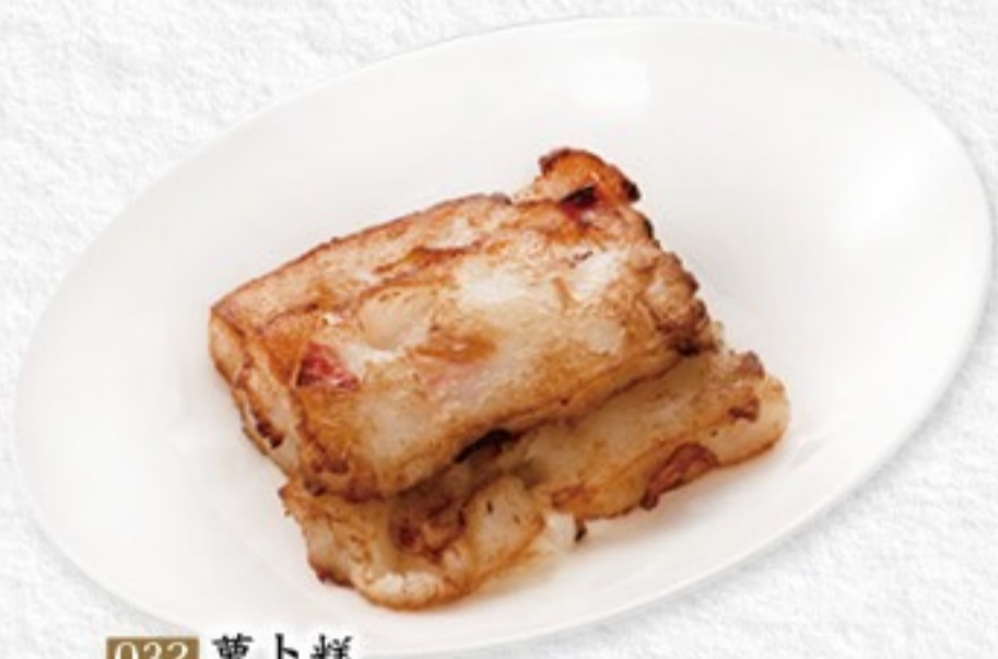
032 萝卜糕 大根モチ(3ヶ) 480円(税込528円)