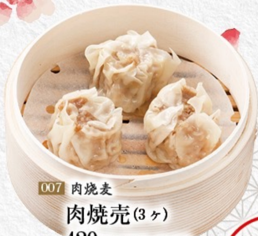
007 肉烧麦 肉焼売(3ヶ) 420円(税込462円)