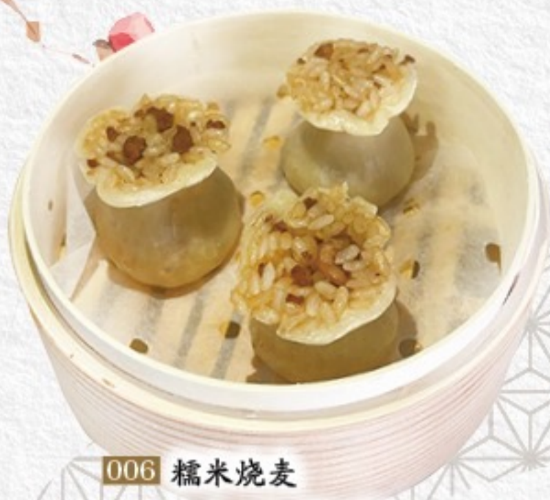
006 糯米烧麦 もち米焼売(3ヶ) 480円(税込528円)